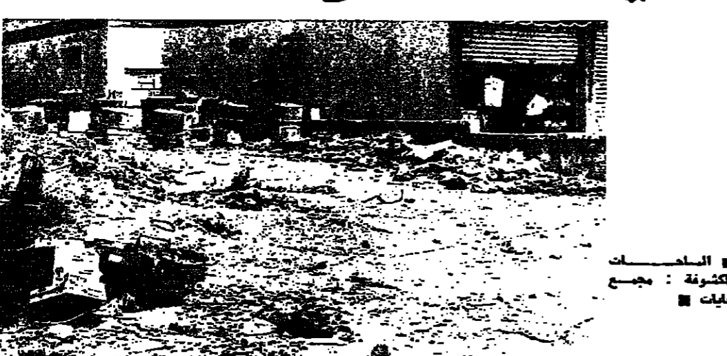
الصالحات الكشوفة : مجمع تفليات

الهلالية - من زوزيا تقويزي محطتنا اليوم على طريق صيدا - جزين ، لا تبعد عن عاصمة الجنوب اكثر من رجة حجر كما يقول المثل - انها بلدة «الهلالية» الرابضة فوق تلة عالية ، وشرفة على سهل صيدا ، ومنتقة الصالحة - مجلدون - موقعا جميل ، لكن اوضاعها ليست كمنظرها الطبيعية كما يقول الاهالي . والشكوى في «الهلالية» كثيرة كثيرها من شكوى القرى الواقعة على طول الطريق بين صيدا وجزين . بلدة أول ما يلفت انظارنا نوجها الى الهلالية اربتها الضمة العالسية ، الهيئة البناء ، مما جعل بعض الناس يسمونها بمنطقة «الزوات» . ومع ذلك يخفي المالك عن كل من يدخل الهلالية ، حيث تاجا بكوارم التفليات تترام على جانبي الطريق الرئيسية ، وفي الارتفاع التي تصل المئات بعضها ببعض . زائر الهلالية يخيل اليه بان لا بلدة نهبوا او انها محطوة لكن الواقع ان حذق بلدية في الهلالية ولها ميزانية محصنة لكن اعمالها غير نشطة . وقد يعود ذلك - كما يقول الاهالي - الى انصاف الرئيس ومخمس الإعفاء الى الشغل الخاصة واعمالهم الوطنية ، لان باب البلدية في الهلالية يفتق ، وحتى لوحة جزين حتى صيدا ! ويقول الاهالي انهم تواصلوا بعد مراجعتهم المستمرة مع المحافظ الذي حل قضية الماء ، ويقام الصلصة